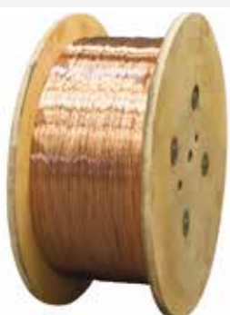
CARRETE 300 kg

Disponible empaquetado especial optimizado para containers. (apilable)