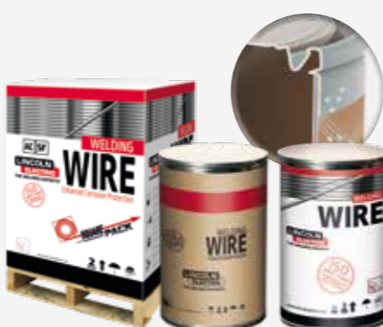
BIDONES SPEED FEED 350/400/600 kg