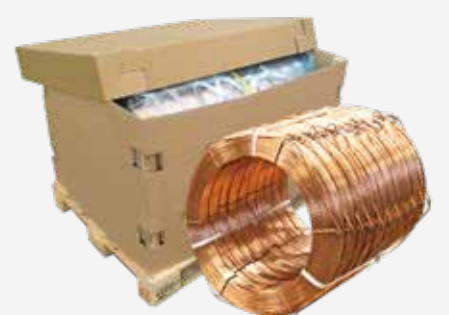
BOBINA 100 kg