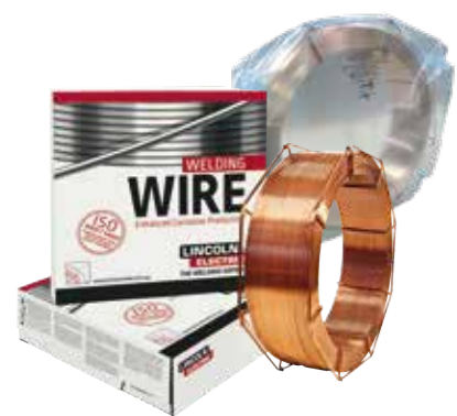
BOBINA 25 kg