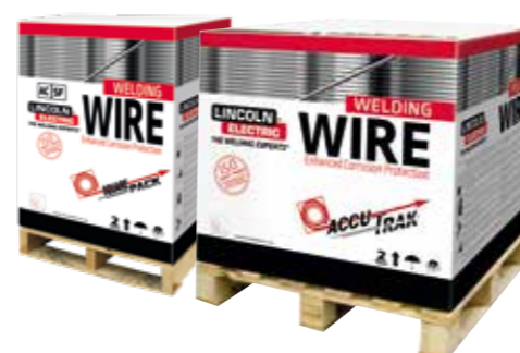
ACCUTRAK 600/1000 kg